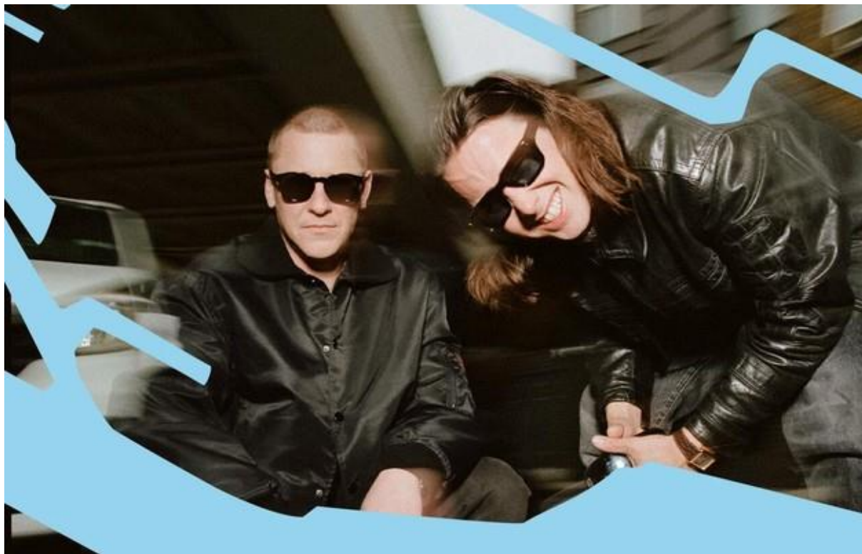
JUNGLE © Arthur Williams